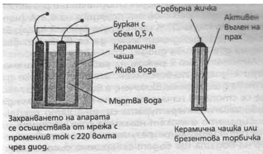
фиг.2. Активатор III